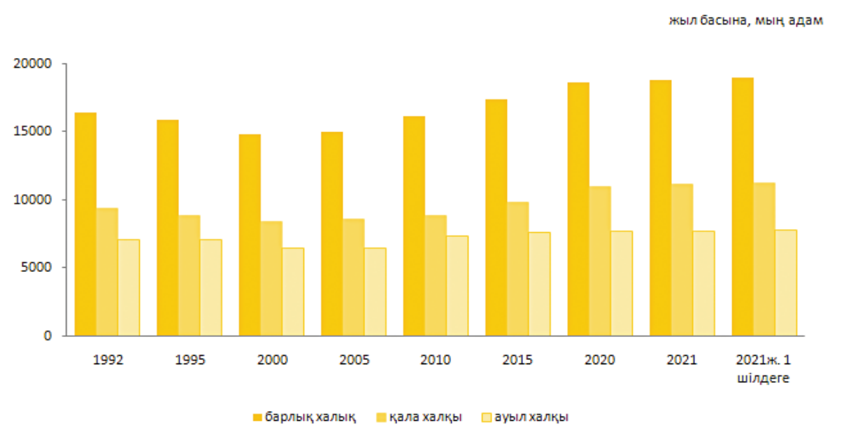
1992-2021 жылдардағы Қазақстан Республикасы халқы саны

Оның ішінде 16,7 миллионы немесе 65,7%-ы — қалада, 8,7 миллионы немесе 34,3%-ы ауылда тұрады. 2030 жылға қарай Нұр-Сұлтан, Алматы және Шымкент мегаполистерінде бүкіл халықтың 27,4%-ы, ал 2050 жылға қарай 36%-ы өмір сүреді», — деп жорамалдайды Еңбек ресурстарын дамыту орталығы.